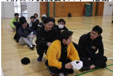
先に集まって、大樹高校生を待つ