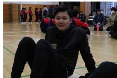
グループ顔合わせ。緊張気味？