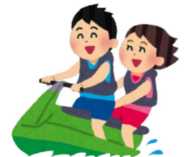
☆写真は見学旅行・マリン体験のヒトコマ。海上をジェットスキーで疾走！！