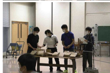
生徒代表挨拶にゲーム進行、お疲れさま!!